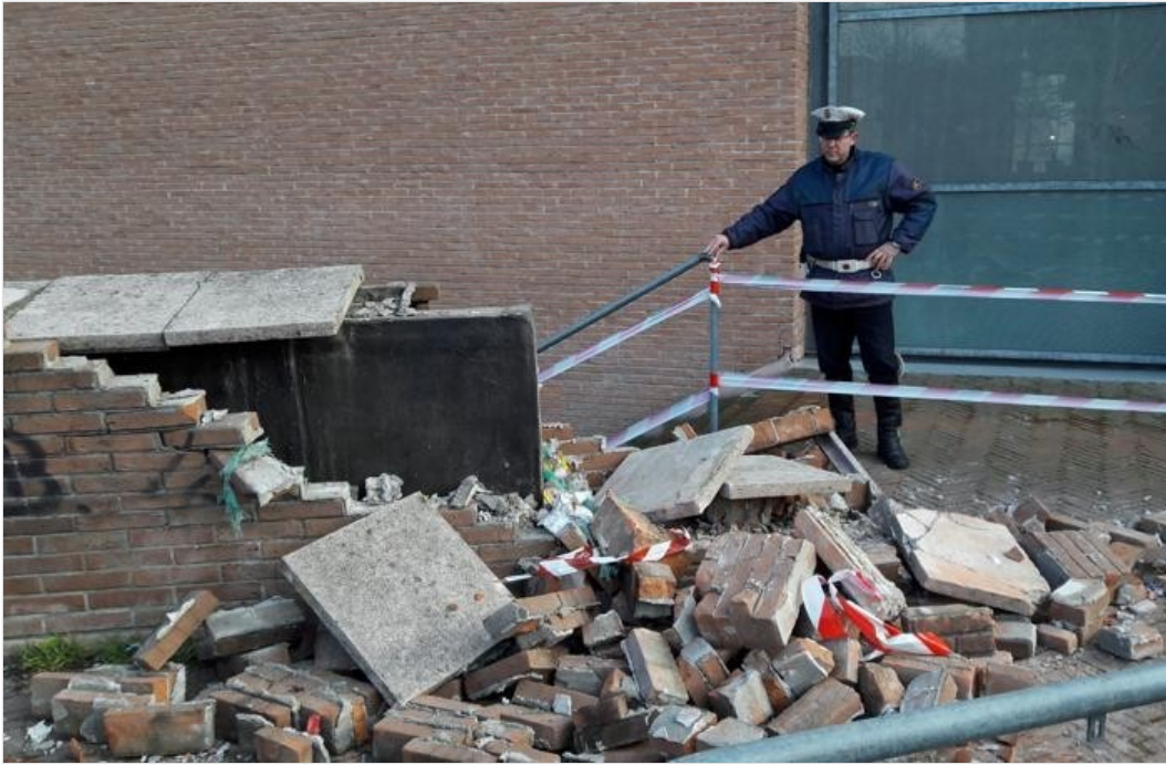
Seregno - L'area devastata dai vandali, fotografata durante un sopralluogo del personale comunale lunedì scorso

Esclusa ogni forma di intimidazione, invece resta solo l'ipotesi bravata per spiegare lo sparo che ha infranto una finestra della sede dell'Avis in via Verdi. Il proiettile sparato da mano ignota ha forato la persiana in alluminio, il doppio vetro della porta finestra, bucato la tenda che è caduto a terra, finendo la corsa contro il muro per rimbalzare infine sul pavimento.