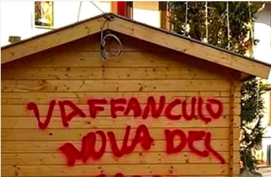
NOVA - la scritta su una delle casette di natale