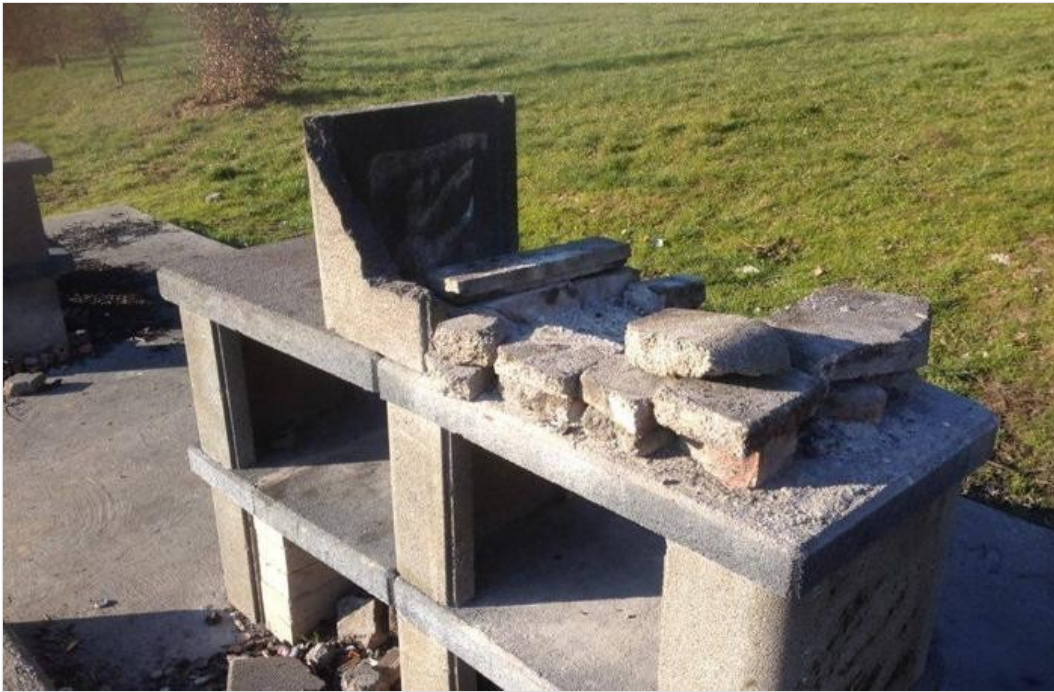
LISSONE: barbecue devastati al laghetto di Lissone

A Lissone sono state vandalizzate e pesantemente danneggiate le 6 postazioni barbecue del Bosco Urbano. Cosa resta dell' "area grigliata" a libera disposizione dei cittadini, l'unica dove è possibile accendere i fuochi negli appositi barbecue, è presto detto: murature fate a pezzi, devastate o danneggiate in più punti. Con lastre abbandonate per terra, tra cumuli di cenere e rifiuti.